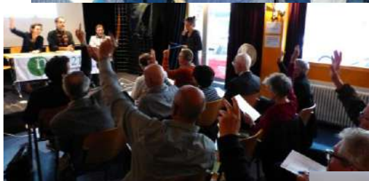
Florilège de photos de l'Assemblée Générale