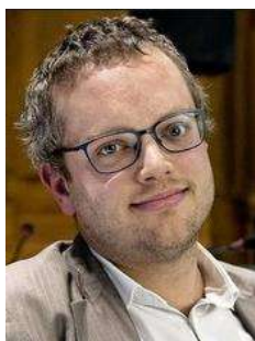
Raphaël Mahaim Député au Grand Conseil vaudois