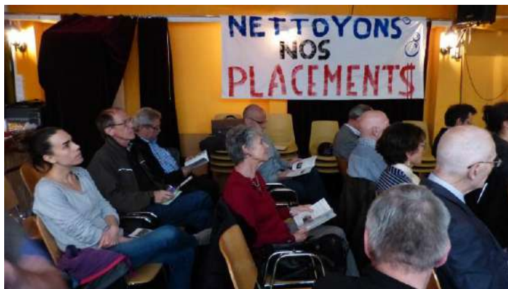
Assemblée Générale de noé21 le 3 mai 2018