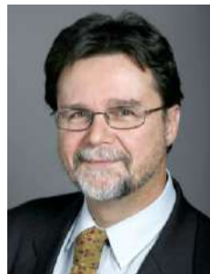
Robert Cramer Conseiller aux Etats (GE)